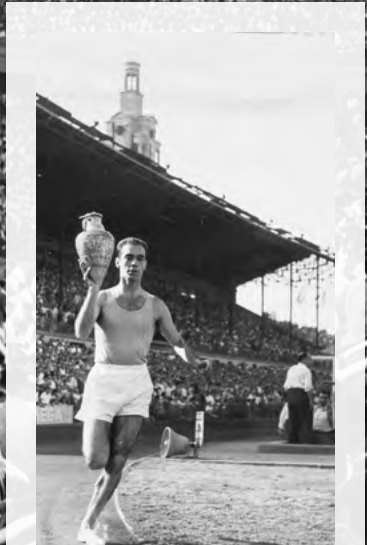
Dos moments de la cerimònia d'obertura dels II Jocs Mediterranis de 1955 a l'Estadi de Montjuïc.