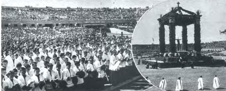
La «Schola Cantorum» y los seminaristas, junto con un coro formado por 40.000 niños y niñas, cantan la misa «Tempus Advénitae et Quaresimales».

EL GRANDIOSO ACTO DEL DOMINGO EN EL ESTADIO