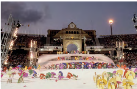
Moment de la cerimònia de la inauguració dels Jocs Paralímpics de Barcelona'92.