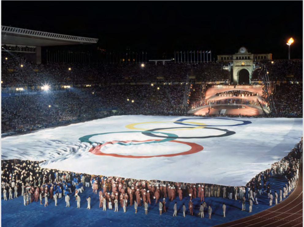
Moment de la cerimònia de la inauguració dels Jocs Olímpics de Barcelona'92.