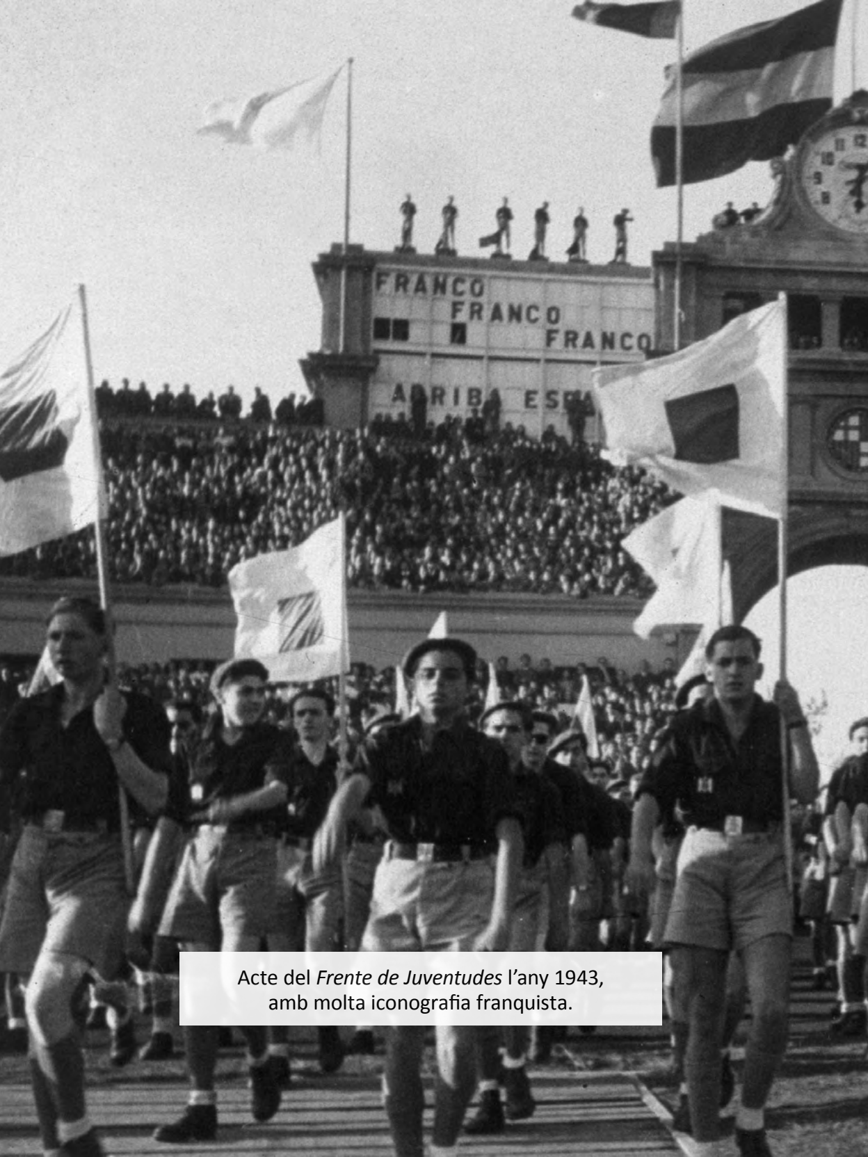
Acte del Frente de Juventudes l'any 1943, amb molta iconografia franquista.