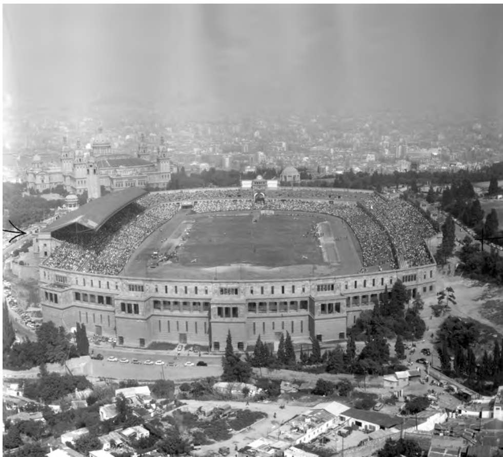
Barraques a Montjuïc, l'any 1963, durant un acte de la Guàrdia Urbana a l'Estadi.