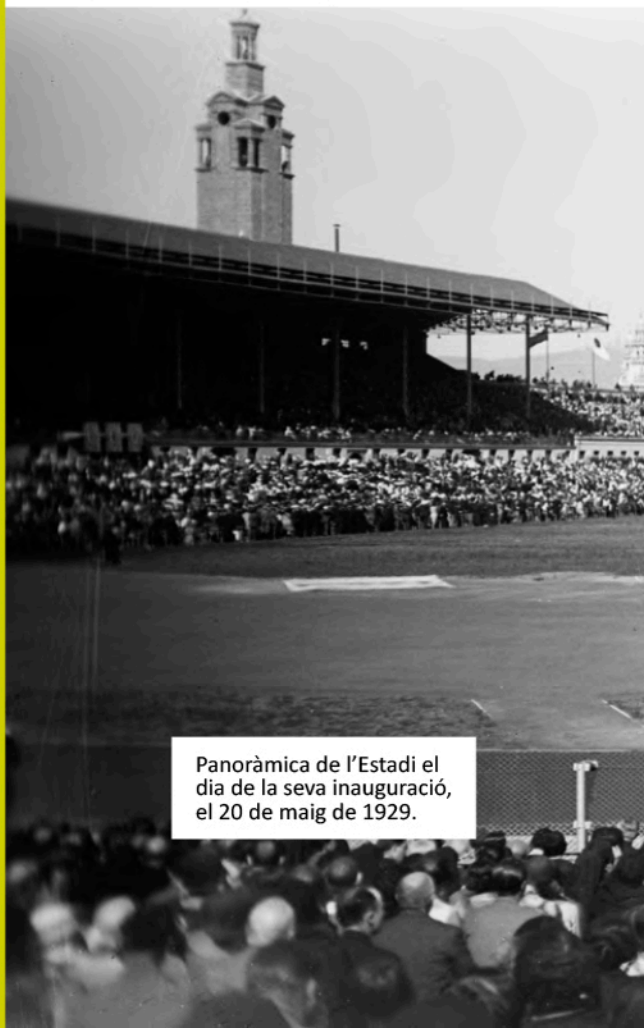
Panoràmica de l'Estadi el dia de la seva inauguració, el 20 de maig de 1929.

Memòria Olímpica, COOB'92, 1992; p. 160.