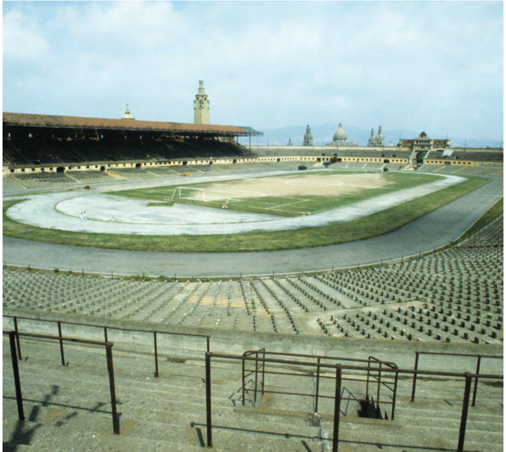
Imatge de l'interior de l'Estadi a finals dels anys 70 del segle XX, evidenciant el seu abandonament.