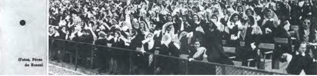
Niños de las escuelas de nuestra ciudad recordando a Pio XII, después de su elevación reciente al pontificado por el papa.